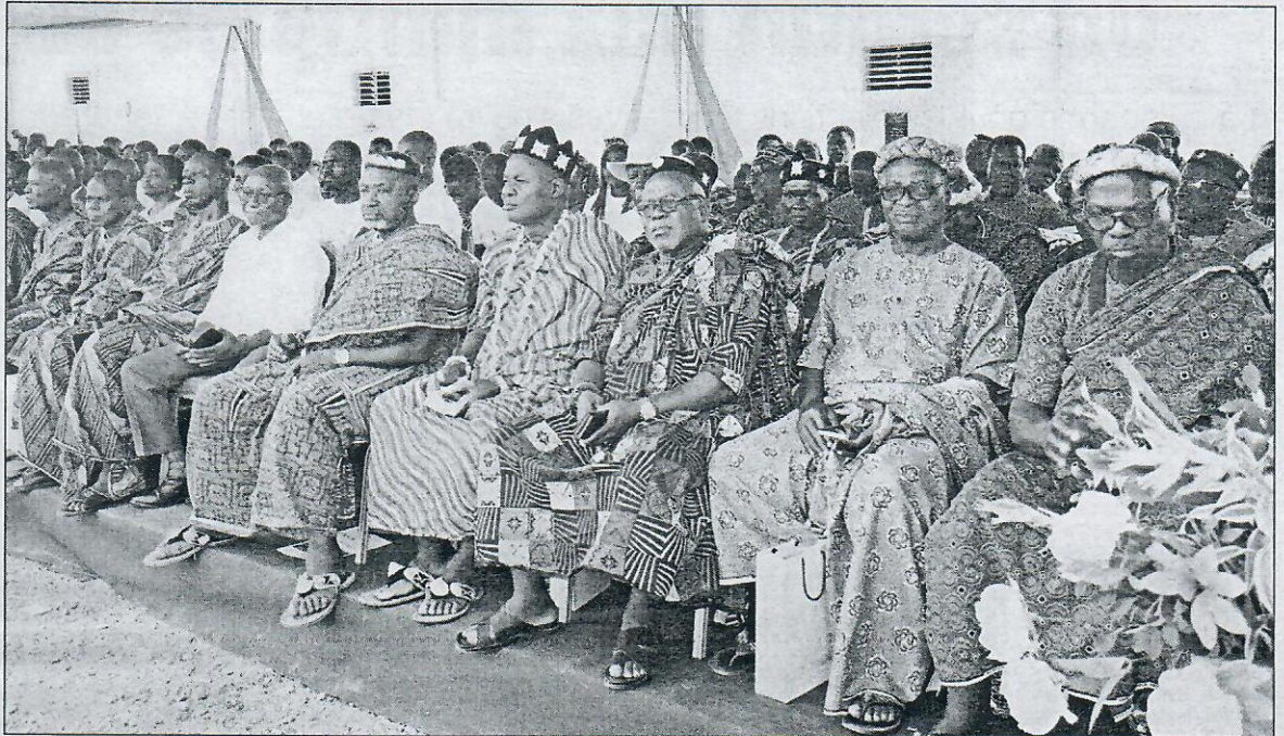
Présence remarquée des chefs coutumiers des villages de Yamoussoukro.